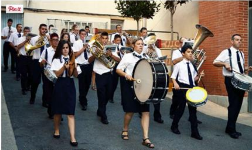
L'Agrupació Musical de Masdenverge, en una imatge d'arxiu.

Arxivat a: Patrimoni, bandes de música, Instagram, Santa Cecília, IPCITE, música